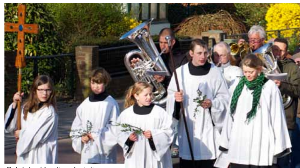
Enkele 'oude' en 'jonge' misdienaars